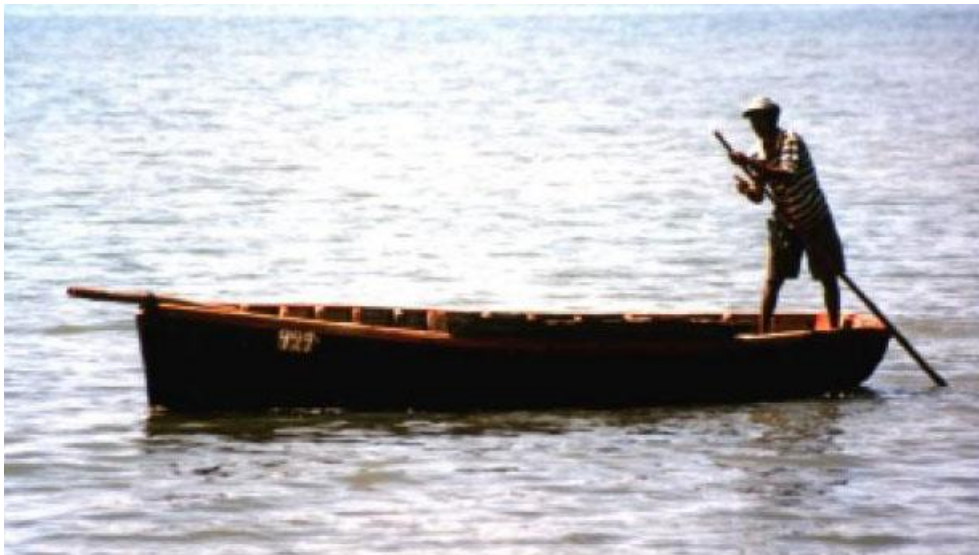
Träbåt på Mauritius

Mina två vänner lyfte båten som jag satt i över revet. Det skrapade i båtens botten. Det var en träbåt och båten var deras livsnödvändighet, så jag förstod att situationen var mycket allvarlig eftersom de utsatte båten för detta. De lyfte båten över till lagunen och simmade för att få fart på den. Jag sa: "Följ med mig!" Men de svarade: "Nej, det blir för tungt, ta med den unga grabben så hjälper han dig i land." Pojken drev fram båten med en lång stav.