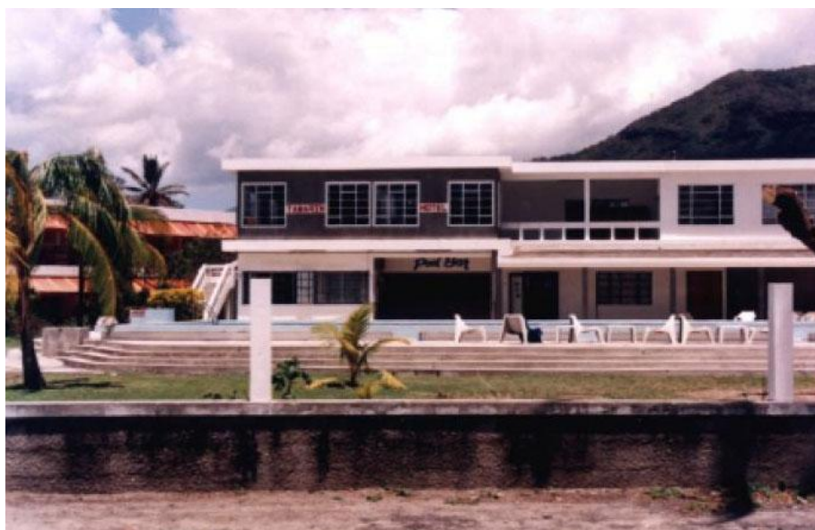
Tamarin Bay Hotel

Ambulansen anlände. Den kom in på parkeringen med påslagna sirener och blinkande lampor, gjorde en u-sväng framför hotellet och körde vidare. Ambulansföraren var från ett sjukhus för svarta, när ingen väntade på ambulansen vid Kineshotellet trodde han förmodligen att han fått fel information.