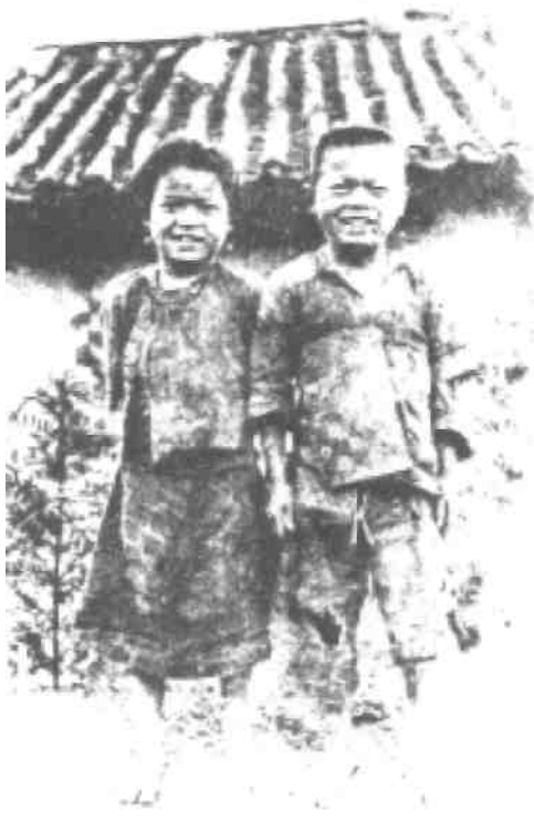
Dva mladí věřící