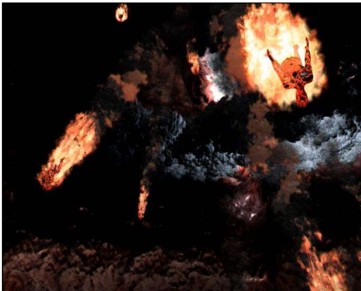
Počítačově vytvořeno – „do pekla dopadají stovky a tisíce lidí“ – každým okamžikem!!!